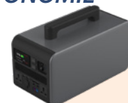
Module autonome PPS2000