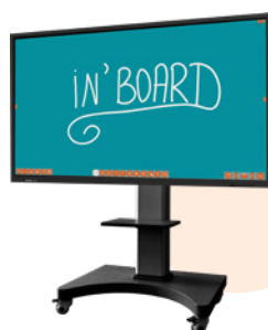
Tableau blanc dictatorial