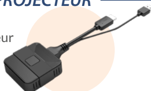
Dongle transmetteur Plug and play TRS-05