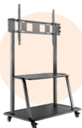
Stand mobile standard ST02