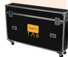
Flight case FC01