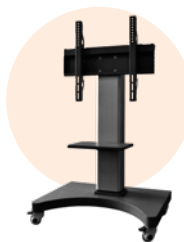
Stand mobile motorisé ST10