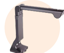
Visualiseur A4/A3 VS02