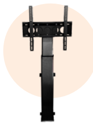
Colonne motorisée ST11