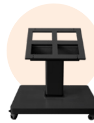
Stand multi angle motorisé ST12