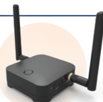
Kit de projection sans fil TR-02