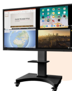
Encore plus de puissance pour votre fonction vidéo projecteur