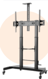
Stand mobile adjustable ST06