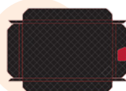
Housse de protection amovible COV-55