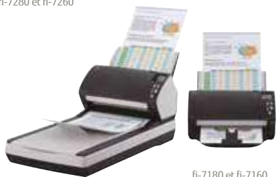
fi-7180 et fi-7160

fi-7160/fi-7260 – A4 Portrait à 300 dpi 60 ppm / 120 ipm fi-7180/fi-7280 – A4 Portrait à 300 dpi 80 ppm / 160 ipm Scannez lots mixtes jusqu'à 80 feuilles