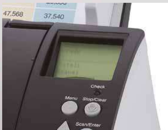
Écran à cristaux liquides intégré dans le panneau de commande

Les scanners fi-7180, fi-7280, fi-7160 et fi-7260 comprennent des fonctions d'administration centralisée que les administrateurs de système peuvent utiliser pour gérer l'installation et l'exploitation de plusieurs scanners, pour contrôler leur état de fonctionnement et pour mettre à jour les pilotes et logiciels à partir d'un seul emplacement. Cette fonctionnalité réduit considérablement le coût et le travail d'installation, d'exploitation et de maintenance des nombreux scanners utilisés dans une organisation et cela permet aussi d'élargir le réseau de scanners dans plusieurs emplacements.