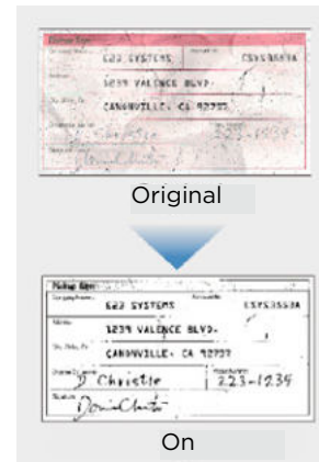
Utilisation du mode de seuil actif

Grâce à ses puissantes fonctions de traitement de l'image, le DR-S130 offre toujours des résultats de haute qualité. Les fonctions telles que la détection automatique des couleurs, la reconnaissance de l'orientation du texte, la détection automatique du format de papier et le redressement vous font gagner du temps. Grâce au mode de seuil actif, il est possible de numériser et de traiter simultanément plusieurs pages d'un document, qu'ils comprennent du texte pâle ou des fonds à motifs, sans avoir à modifier les paramètres, faisant ainsi gagner un temps précieux.