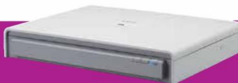
Glace d'exposition A3 Flatbed 201