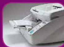
Position haute (100 feuilles)

Le chargeur de documents dispose de trois modes sélectionnables (100, 300 et 500 feuilles) qui permettent de s'adapter au volume des lots à numériser, afin de gagner du temps et d'améliorer le rendement.