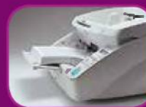
Position intermédiaire (300 feuilles)