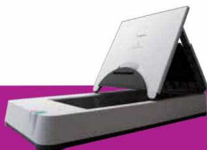
Glace d'exposition A4 Flatbed 201

Bénéficiez d'une qualité d'image irréprochable avec Kofax VRS. La numérisation devient plus simple grâce à sa capacité de traitement d'image et de gestion automatique des documents. La qualité d'image obtenue, inégalable sur le marché, améliore la lisibilité et augmente la capacité de reconnaissance optique de caractères (OCR).