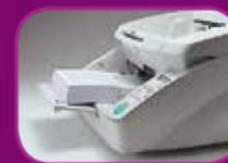
Position basse (500 feuilles)